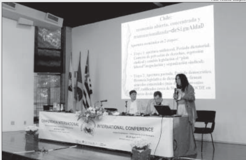
Mesa da Conferência Internacional Desenvolvimento Global: Desafios às Estratégias Sindicais, realizada no Instituto de Economia