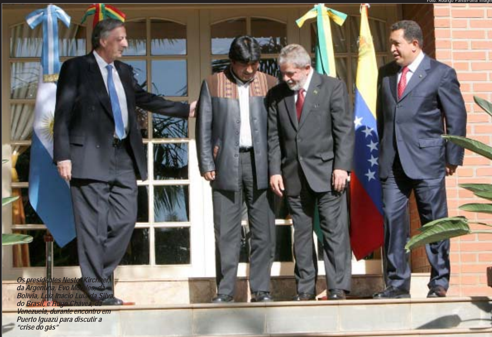
Os presidentes Nestor Kirchner, da Argentina, Evo Morales, da Bolívia, Luiz Inácio Lula da Silva, do Brasil, e Hugo Chávez, da Venezuela, durante encontro em Puerto Iguazú para discutir a "crise do gás"