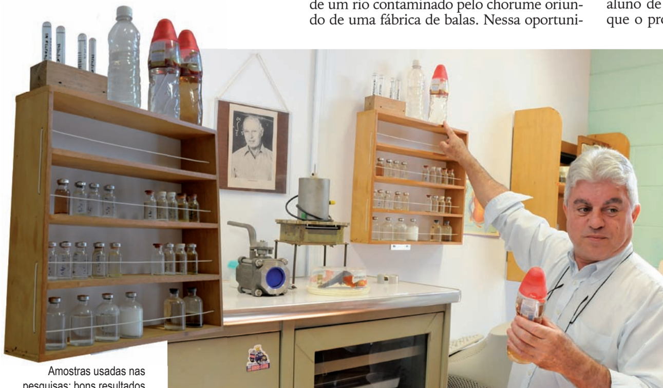
Amostras usadas nas pesquisas: bons resultados

A preocupação do pesquisador também é a de procurar localizar a existência de um sistema de simulação computacional que pudesse vir a ser utilizado no estudo da viabilidade desses tipos de processos, o que viria a facilitar sobremaneira o estudo, pois já dispõe de muitos dados que podem nortear projetos futuros. Ele faz questão de enfatizar que tem desenvolvido seus trabalhos construindo os equipamentos e adaptando componentes de forma a realizar uma pesquisa básica a custos muito baixos: “Os trabalhos que orientamos desenvolveram-se praticamente a custo zero. A fonte de tensão, por exemplo, resulta do aproveitamento de fontes descartadas de computadores, nas quais são feitas modificações para obter correntes elétricas elevadas, maiores que 20 ampères para tensão de 15 volts”, conclui.