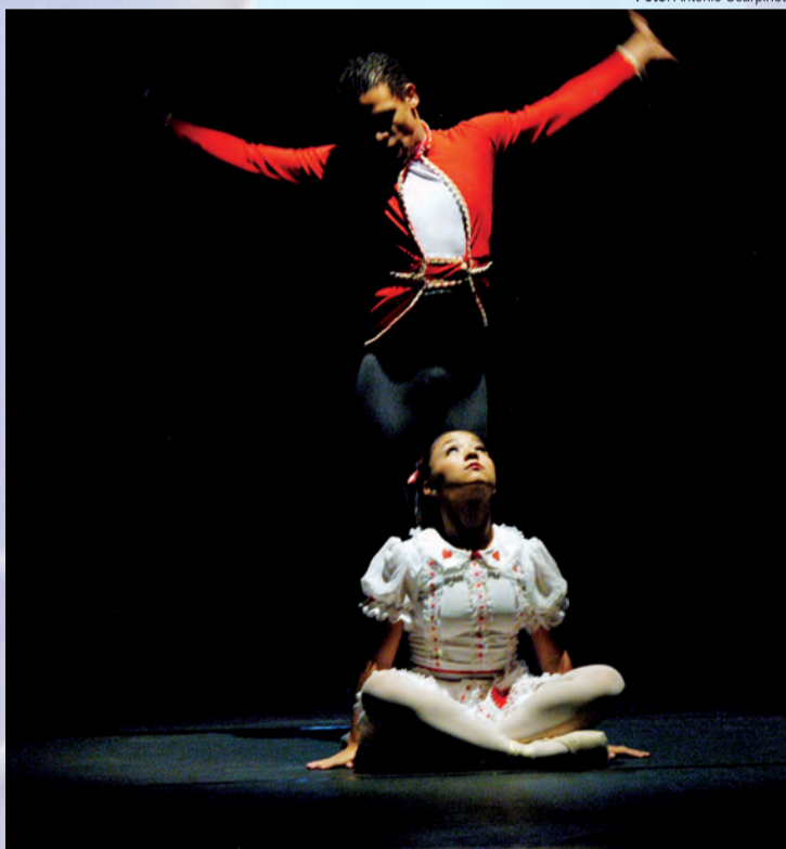
Bailarinos em ação: segundo a coordenadora, “as dificuldades vividas no mundo da arte são intensificadas quando analisamos as trajetórias de mulheres artistas, inclusive na dança, único campo onde são predominantes”