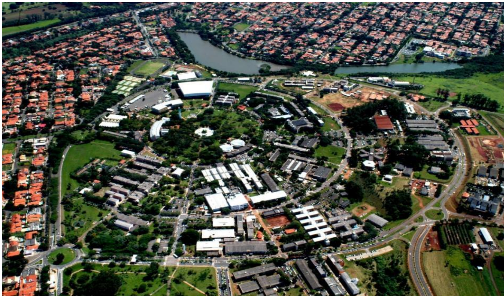
Vista aérea do Campus da UNICAMP - Campinas/SP - Atualmente