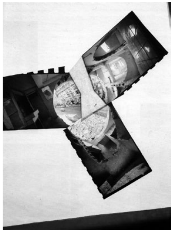
1 Gordon Matta-Clark. Esquema para Interseção Cônica ( Schematic for Conical Intersect ), 1975.