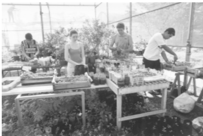
Estudantes no viveiro de mudas construído ao lado do Instituto de Biologia: recuperação da flora

Até o momento, o projeto permitiu a realização de dois grandes plantios, um no Parque