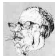
Caricatura de Sérgio Buarque de Hollanda