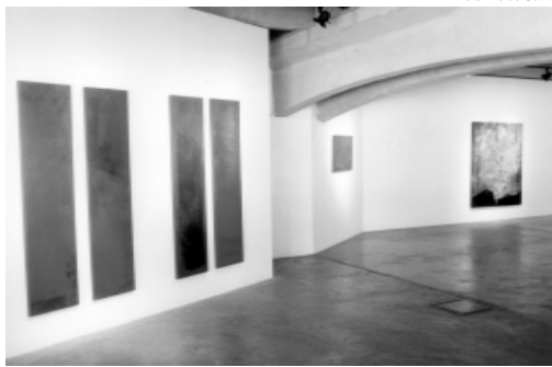
Vista geral dos quadros de Lygia: imagens fixadas na memória

Muitas das idéias impressas nos cadernos resultaram em Montanhas, exposição que Lygia está promovendo até o próximo dia 26, na Galeria de Arte Unicamp, andar térreo do prédio da Biblioteca Central. Ao todo são onze pinturas a óleo, de diversos tamanhos — de 60 cm x 80 cm, de 1 m x 2 m e até de 1,80 m x 1,80 cm. Em oito cadernos de desenhos, a professora anota o seu cotidiano. E mais uma pequena caixa de madeira, que significa “um pensamento pictórico”, como Lygia a define. Nessa caixa, em poder da artista há aproximadamente cinco anos, havia um desenho de Portinari. Não por desrespeito, é esta caixa que ela usa se sentar quando produz as suas telas, e também onde costuma limpar seus pincéis. “Totalmente despojada de conceitos ou