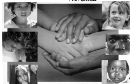
Cartaz ilustrativo do simpósio