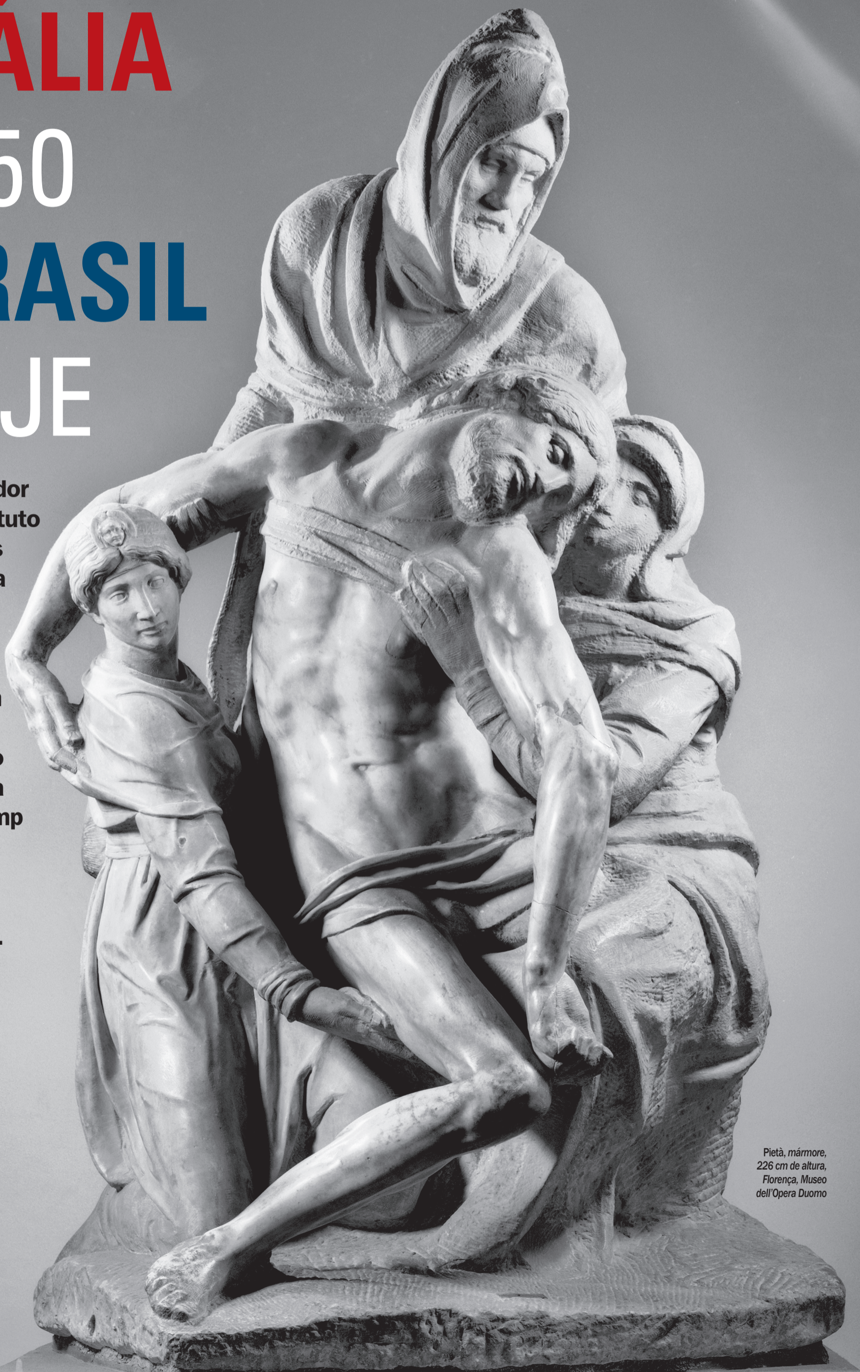
Pietà, mármore, 226 cm de altura, Florença, Museo dell'Opera Duomo