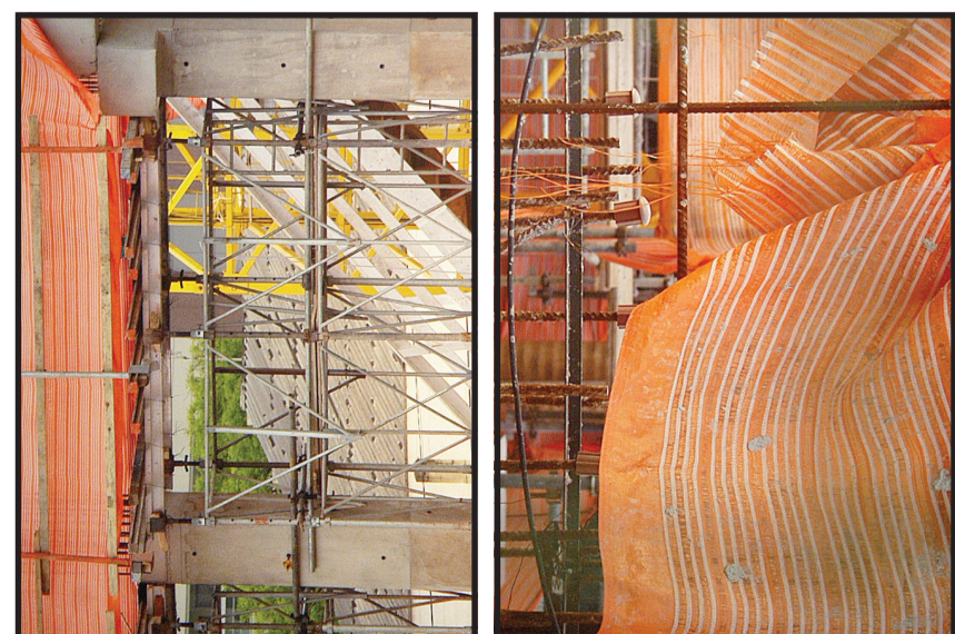
Obras de Bruno Baptistelli