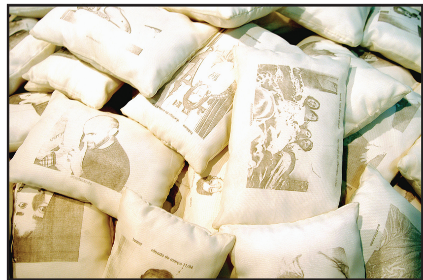
Instalação de Tatiana Portela