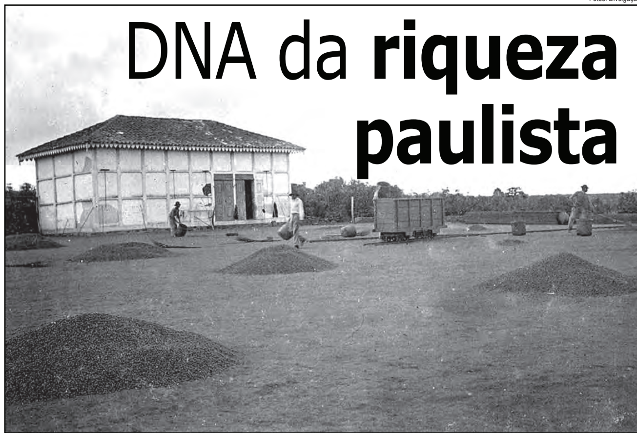
Terreiro de café e tulha da Fazenda Paraizo, em São Carlos (SP), em foto de 1912