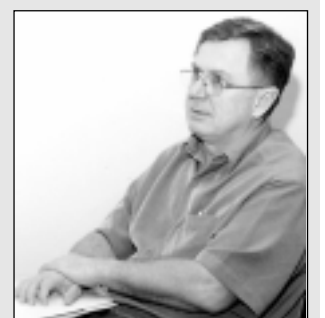
Pedrosa: bactéria como adubo

crescimentos vegetais e metabólicos de interesse industrial (ácido glucônico). O potencial de fixação biológica de nitrogênio associado à cultura da cana-de-açúcar é de 65% do nitrogênio total retirado por tonelada colhida, e uma redução de 30% na quantidade de fertilizantes aplicados na cultura no País, o que permitiria uma economia de cerca de R$ 59 milhões por ano.