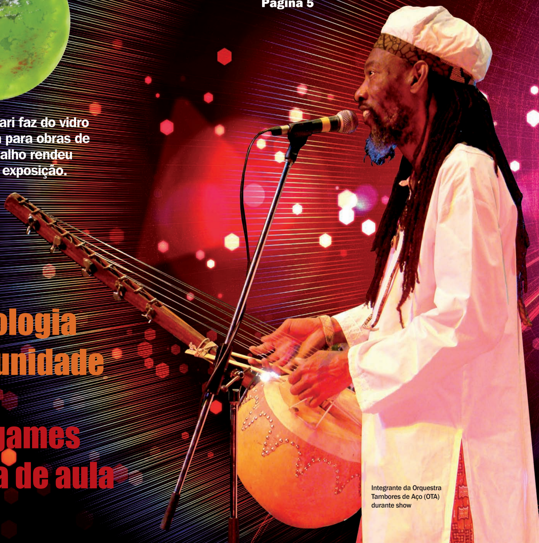
Integrante da Orquestra Tambores de Aço (OTA) durante show