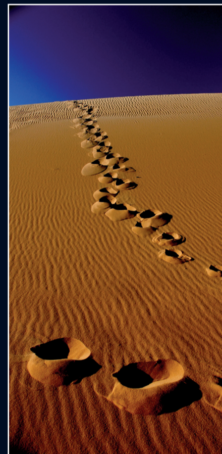
Paisagens do Jalapão são tema de tese