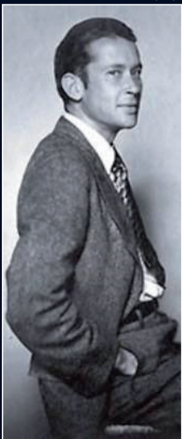
O poeta americano E. E. Cummings

A matemática e a preservação do palmito juçara