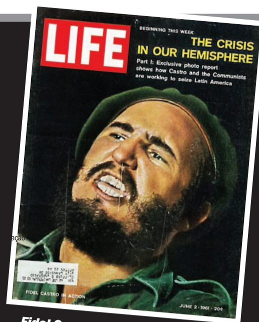
Fidel Castro e o perigo do "avanço comunista": estratégia