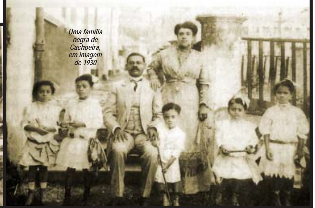
Uma família negra de Cachoeira, em imagem de 1930