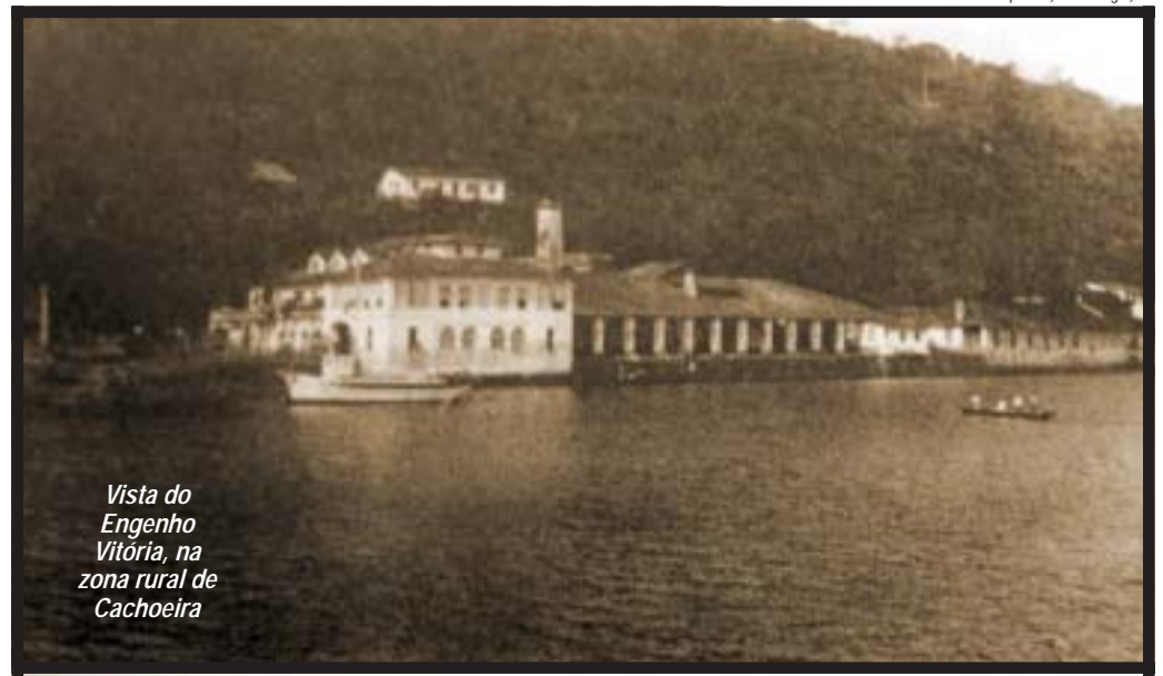
Vista do Engenho Vitória, na zona rural de Cachoeira