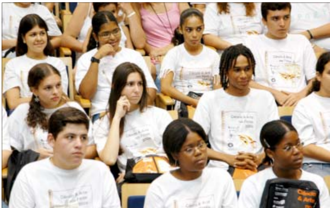
Público observa painéis montados na edição de 2006: resultado de um mês de estágio dentro do laboratório

Em sua 5ª edição, programa recebe alunos do ensino médio para estágio de um mês nos laboratórios