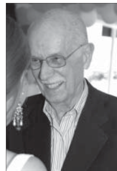
"O Brasil sempre foi um país de excelente crítica literária"

Antonio Candido — Eu creio que não. O Brasil sempre foi um país de excelente crítica literária, desde o tempo da Independência. O Brasil sempre teve e continua tendo bons críticos li-