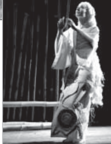
realização foi possível pela unidade estabelecida entre os alunos

Cenas de Qio.Guem?, espetáculo dirigido por Alice K: a Caos Cia de Teatro traz ainda os prêmios de direção, cenário, iluminação, concepção sonora e ator