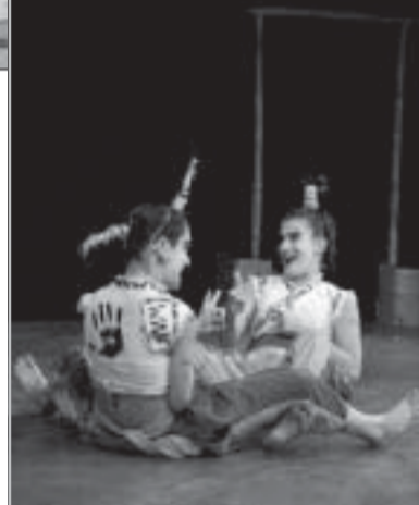
tem concepção sonora de Gregory Silvar. Na opinião de Dandara, a