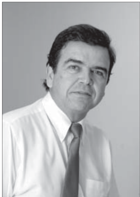
Arruda: "As atividades de ensino vinculadas à extensão, incluindo o suporte ao vestibulando, deverão ser priorizadas"