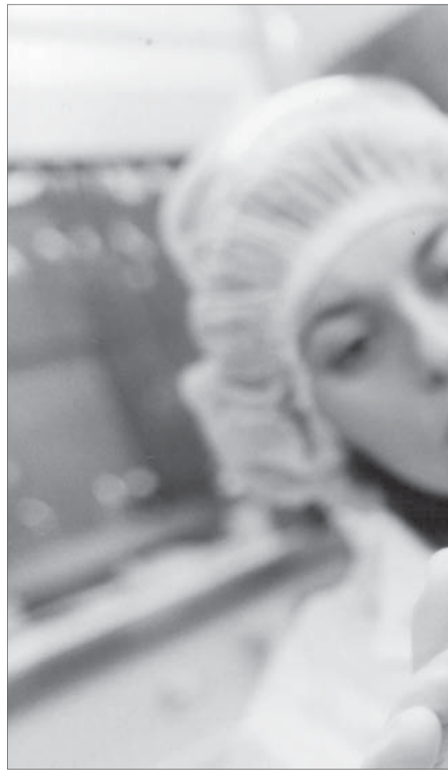
Técnica manipula máscara para microfabricação no Centro de Componentes Semicondutores:

Outra medida indispensável é adaptar a legislação interna às legislações federal e estadual, considerando questões como a de direitos autorais e de licenças de uso relativos aos conteúdos produzidos no âmbito da Universidade. São ações que requerem um esforço decisivo que leve ao aproveitamento de todos os recursos disponíveis e consolide um projeto institucional na área.