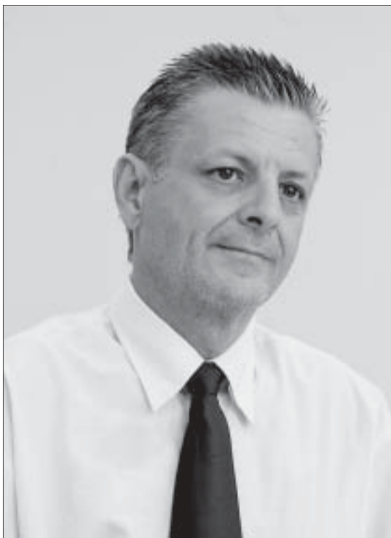
Moschim: "A política interna de pesquisa é balizada pela avaliação institucional com parâmetros definidos pela Capes"