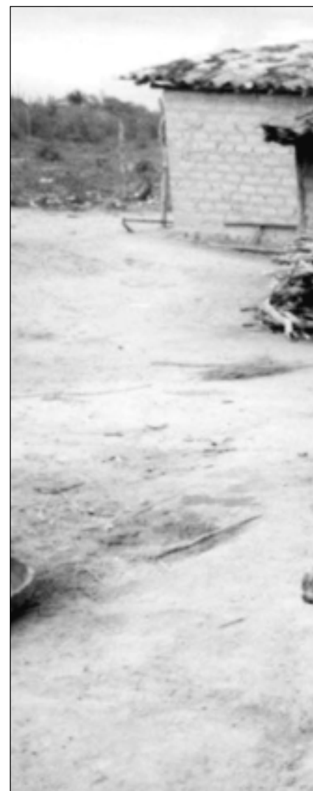
Cisterna no sertão nordestino: segundo Cláudio