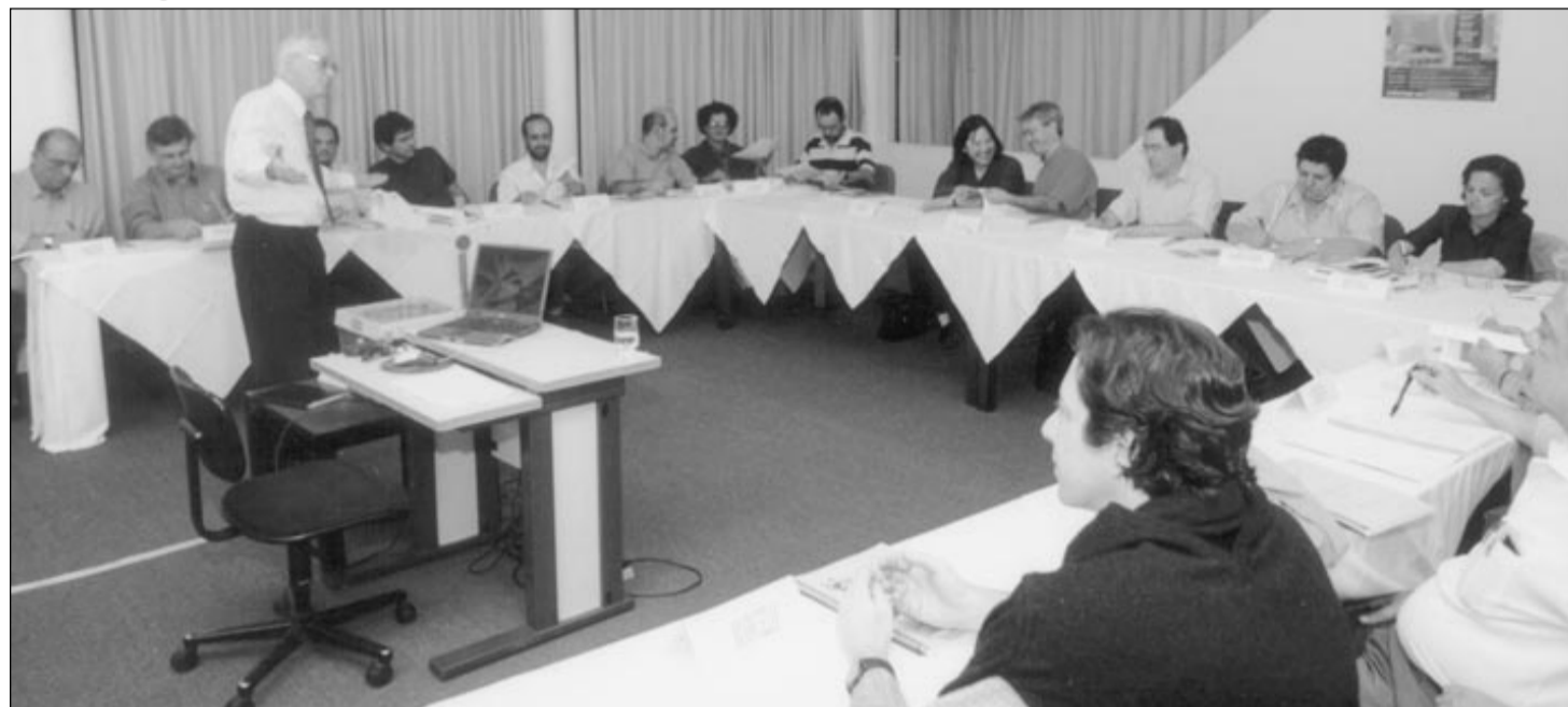
Um dos recentes seminários de gestão estratégica, na Unicamp

Após dois anos de intensa discussão, a Unicamp começa a estruturar neste mês as linhas que definirão o seu futuro. Uma comissão formada por representantes de todos os segmentos da Universidade se reunirá no próximo dia 16 para redigir o texto que servirá de base para o documento-guia do Planejamento Estratégico (Planes) da Universidade. O texto definitivo começa a ser consolidado dia 30 pelo Conselho Universitário. Em entrevista ao Jornal da Unicamp , o vice-reitor José Tadeu Jorge detalha os objetivos do Planes.