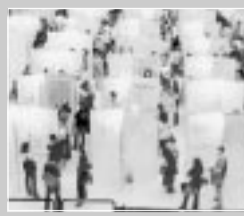
Páginas 3 e 4