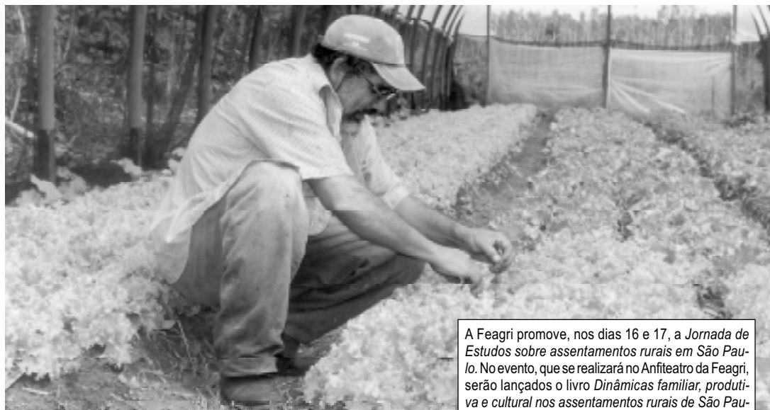
A Feagri promove, nos dias 16 e 17, a Jornada de Estudos sobre assentamentos rurais em São Paulo. No evento, que se realizará no Anfiteatro da Feagri, serão lançados o livro Dinâmicas familiar, produtiva e cultural nos assentamentos rurais de São Paulo e A alternativa dos assentamentos rurais: organização social, trabalho e política . As inscrições, gratuitas, podem ser feitas na Coordenadoria da Pós-Graduação/Feagri ou pelo site www.agr.unicamp.br/jornadaassentamentos .