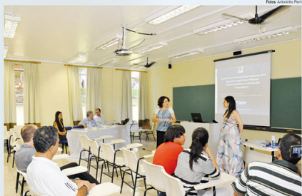
Defesa de tese: nota média dos programas de pós-graduação da Unicamp vem aumentando a cada ciclo avaliativo

Além de manter a liderança nacional em relação à qualidade, a pós-graduação da Unicamp também vem expandindo as atividades nesse segmento. Entre 2009