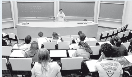
Encontro do Programa de Estágio Docente: reestruturação agiliza análise de projetos e relatórios