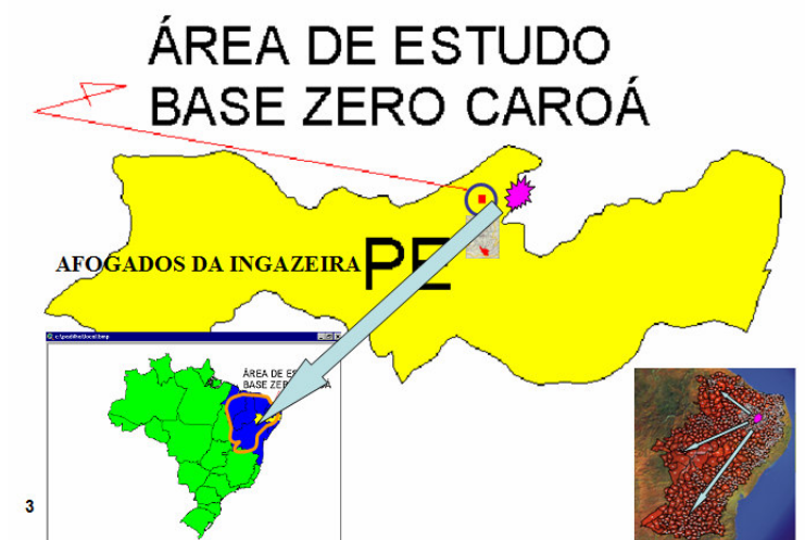
Figura 1. Localização do estudo de caso

Um CBZ consolidou-se em 1989, na Fazenda Caroá situada na MBH Carapuça, em Afogados da Ingazeira, Estado de Pernambuco.